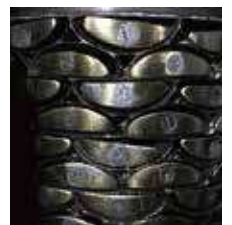
柿の種あられの金型