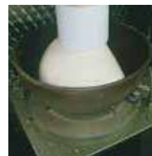
もち米を杵でつく

柿の種とピーナッツの比率は、創業以来5:3。質実剛健なおいしさをご賞味ください。