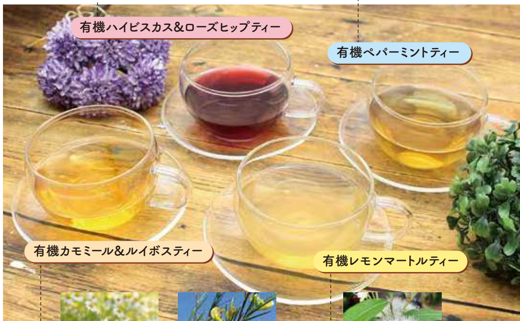
有機ハイビスカス&ローズヒップティー

新発売の有機ハーブティー4種も、たっぷり20袋入りで税込864円~950円と気軽に飲んでもいただけるお値段。もちろん品質に一切の妥協はなく、世界中から厳選したオーガニックハーブを100%使用した有機JAS認証商品