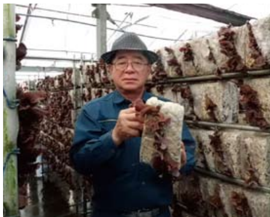
栽培品目【きくらげ】